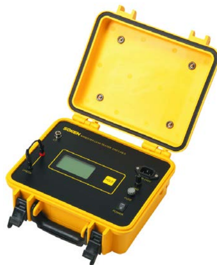
避雷器漏れ電流測定器 (DAC-LAS-3)