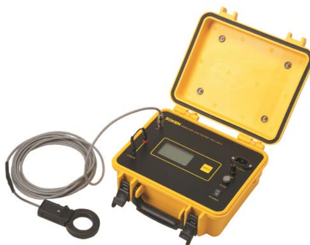
避雷器漏れ電流測定器 (DAC-LAS-3)