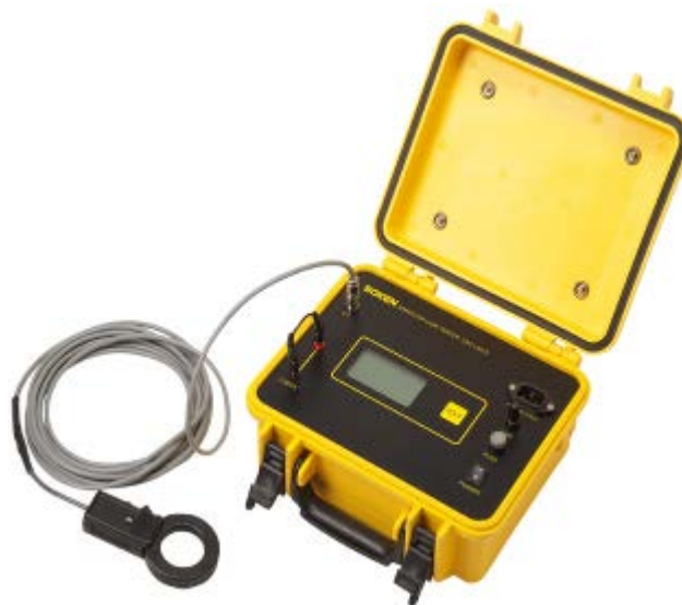
避雷器漏れ電流測定器 (DAC-LAS-3)