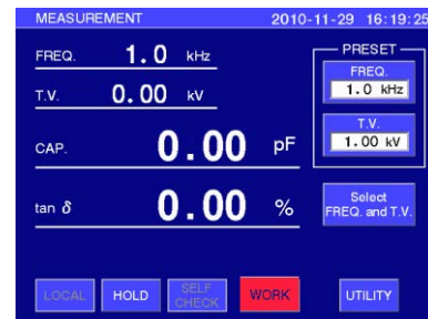
DAC-HFM-1 液晶タッチパネル